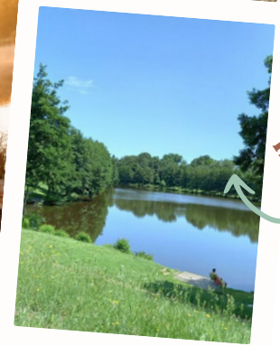
Lago di Hurgues