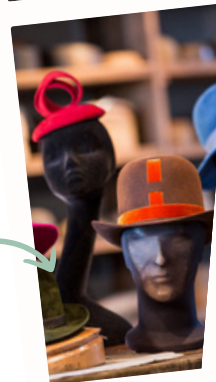
Museo del cappello