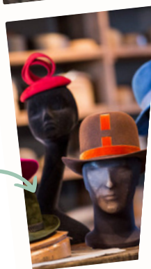
Musée du chapeau